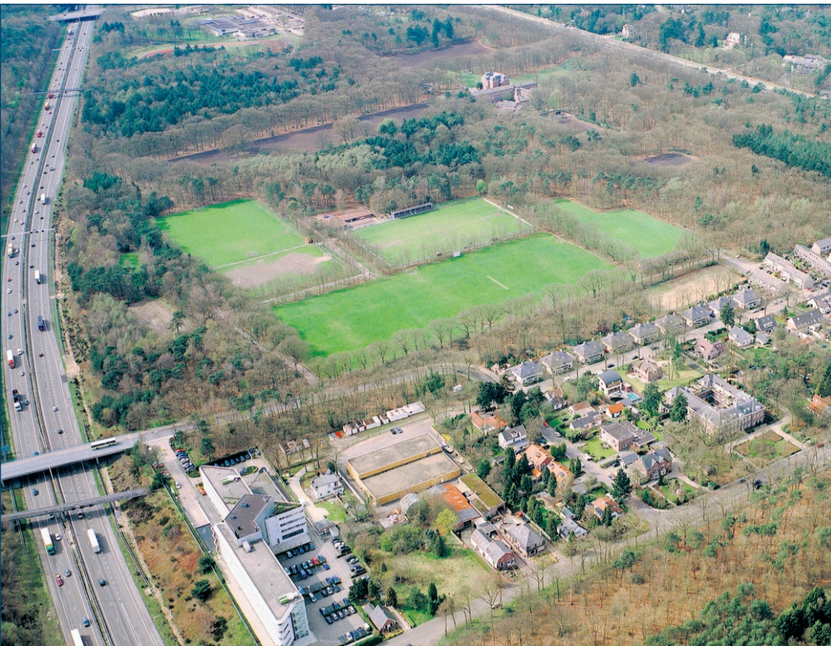
Er komen voorlopig geen woningen op de sportterreinen in Huis ter Heide West.