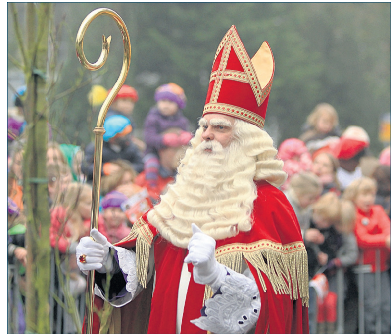
Sinterklaas komt zaterdag 23 november naar Den Dolder.

Centrummanagement Zeist, de Van Veenendaal- Bot Stichting en de gemeente maken 'Zeist Sinterklaasstad' mogelijk. Slot Zeist zal tot 5 december het onderkomen zijn van de goedheiligman en zijn pieten. Op 24 en 30 november en 1, 2 en 4 december kunnen kinderen en hun ouders een rondleiding krijgen door het grote huis van Sinterklaas. Er is een werkkamer, een pietenkamer, een pakjeskamer, een pientreningskamer, een speelgoedtestkamer en natuurlijk ook de slaapkamer te bewonderen. Ron Boszhard speelt in Figi de Sinterklaasvoorstelling 'De verdwenen pakjes van Piet' op 24 november en 4 december. Kijk voor meer informatie op www.zeistsinterklaasstad.nl .